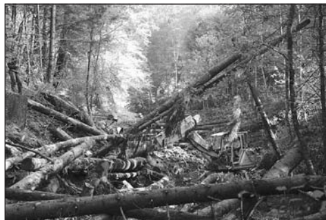
Les bois ont été acheminés par un câble grue