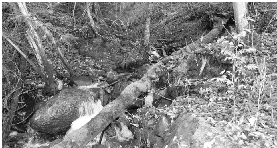
Situation avant les travaux

Le Ruisseau des Branches qui traverse notre village compte de nombreux seuils en béton ou en bois. Une grande partie des seuils en béton a été réalisée dans les années 1960, suite à une crue ayant causé d'importants dégâts en 1948. Plusieurs ouvrages en bois ont été réalisés ces dernières années sur le haut du ruisseau. Entre le chalet du Sot et le pont des Méley, à une altitude allant de 900 à 930 m, un secteur de 200 m de long était encore sans ouvrages. Afin de compléter ce tronçon manquant, 10 seuils en bois ont été réalisés entre mi-août et mi-octobre 2014. Ces ouvrages permettent de stabiliser le lit de ce cours d'eau et les rives et donc de diminuer également l'apport de bois flottant.