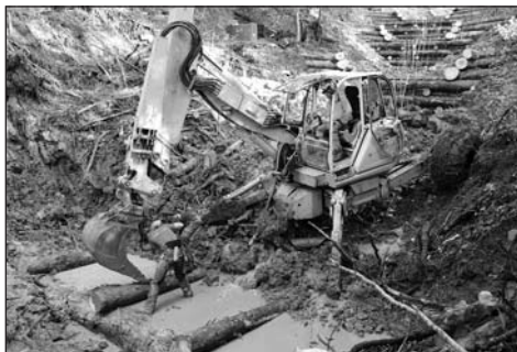
Un travail qui exige de l'expérience