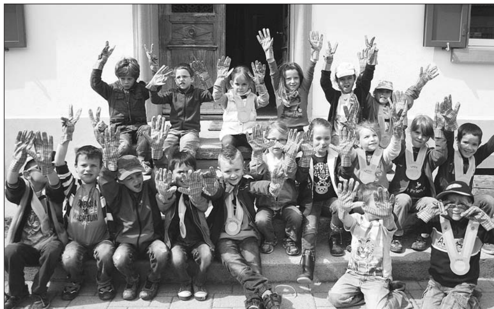
Equipés et prêts pour la journée «coup de balai»