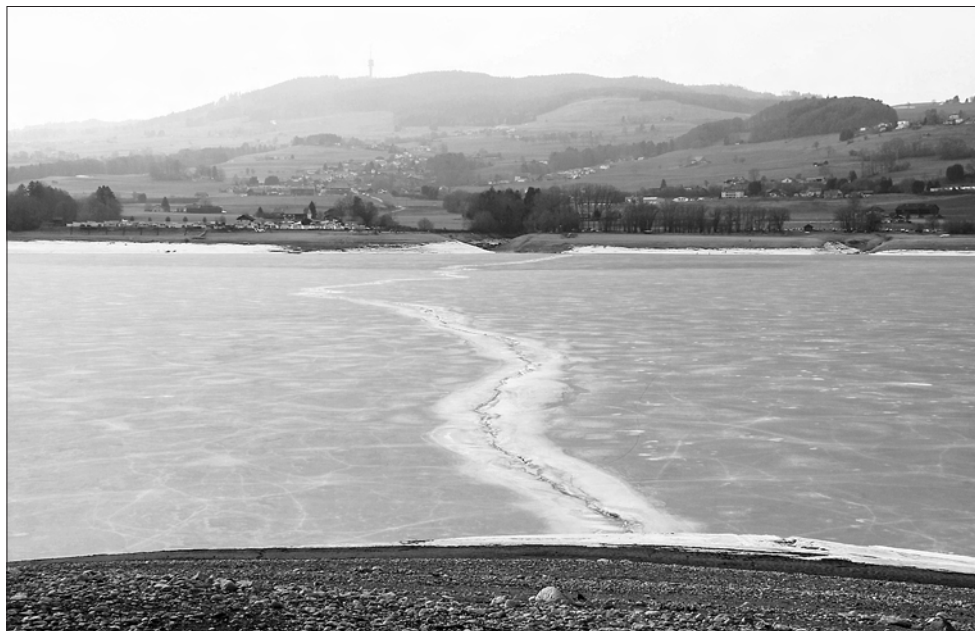
Fissure étonnante sur le lac gelé de la Gruyère (4 mars 2012)