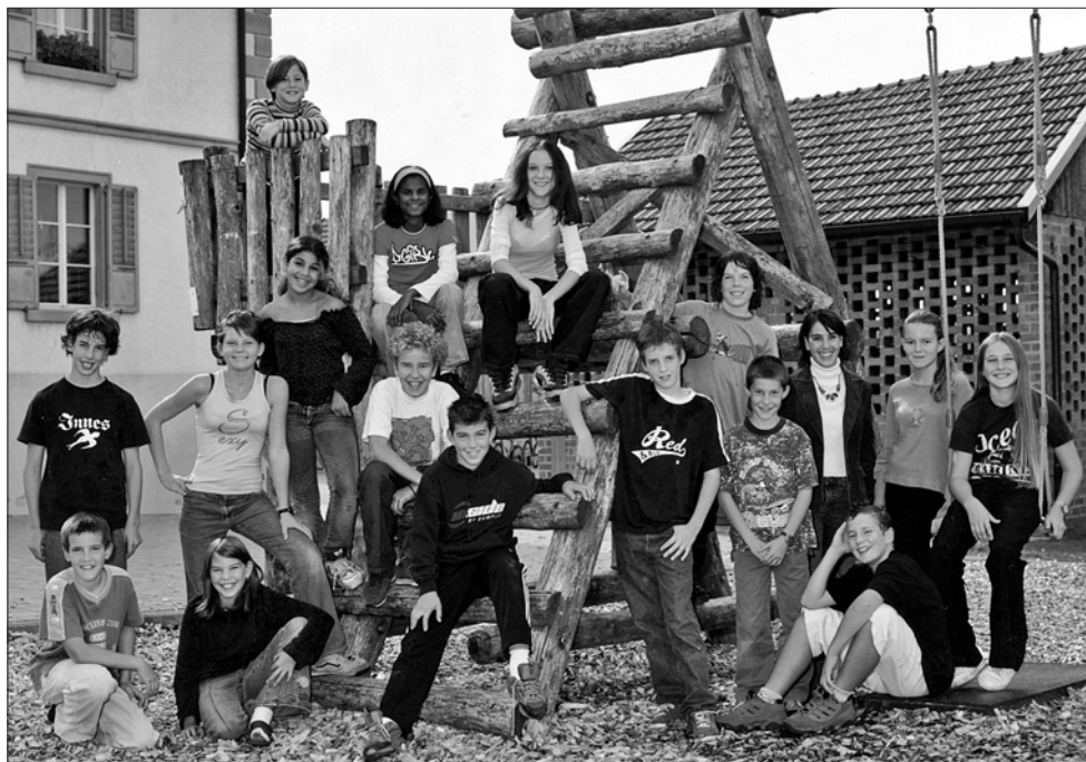
Photo des élèves de 6 ème primaire du cercle scolaire de Hauteville, Corbières et Villarvolard prise en automne 2003 à Hauteville.