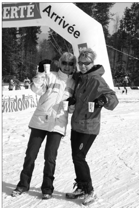
La bonne humeur régnait au ravitaillement lors du Grand Prix La Liberté organisé par le Ski-Club Hauteville.