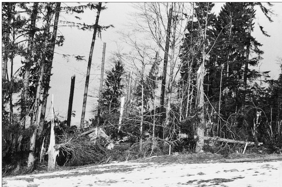
La région du Lanciau (photo ci-dessus), la Lévanchette ainsi que la zone de Marais Rouge et Pré aux Oies ont été particulièrement touchées.

Le canton de Fribourg a réagi vite et bien au méfaits de Lothar. Le Conseil d'Etat a débloqué en urgence 8,8 mio pour cette année 2000 et le Grand Conseil a voté deux crédits pour un total de 13,6 mio pour les années 2001 à 2003.