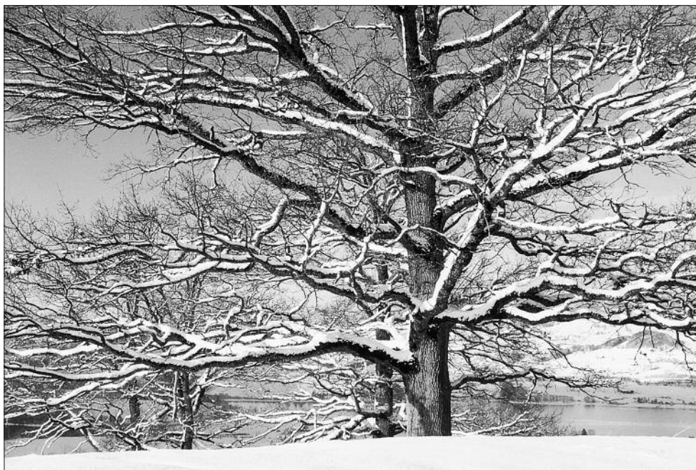
Chêne majestueux au-dessus de Hauteville, photo Jean-Marie Castella