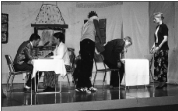
Les jeunes ont fait preuve d'imagination et de talent.

Assemblée d'octobre 1970. Les jeunes demandent un terrain de sport à la Commune qui le leur accordera, terrain qui servira à l'école pour les leçons d'éducation physique.