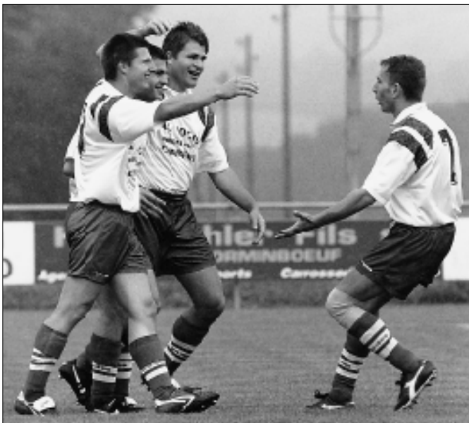
L'entente entre les joueurs a été l'une des clefs du succès.

Un match de barrage était nécessaire pour l'attribution du premier de groupe et le mercredi qui suivait Corbières et Sâles se retrouvaient à Gruyères.