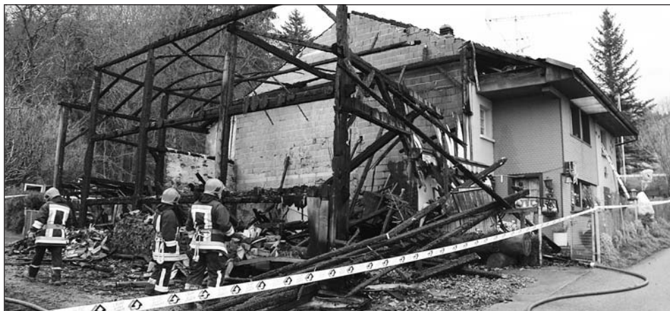
L'intervention rapide des pompiers a permis d'éviter le pire.