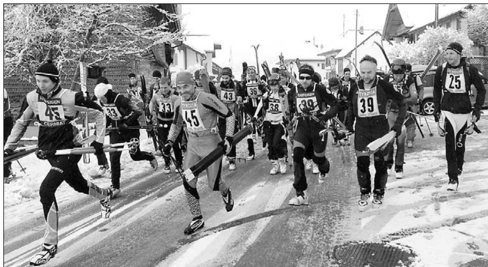
Départ à Cerniat dans la bonne humeur

L'édition 2015 du Trophée de La Berra, à fin février, a été une belle réussite. La preuve: la salle paroissiale de Hauteville qui accueillait les participants et leurs accompagnants pour la soupe de chalet s'est révélée trop petite. Une quarantaine de personnes étaient attendues, il en est venu une septantaine. Au passage, le Ski-Club Hauteville remercie la paroisse pour la mise à disposition gratuite de la salle.