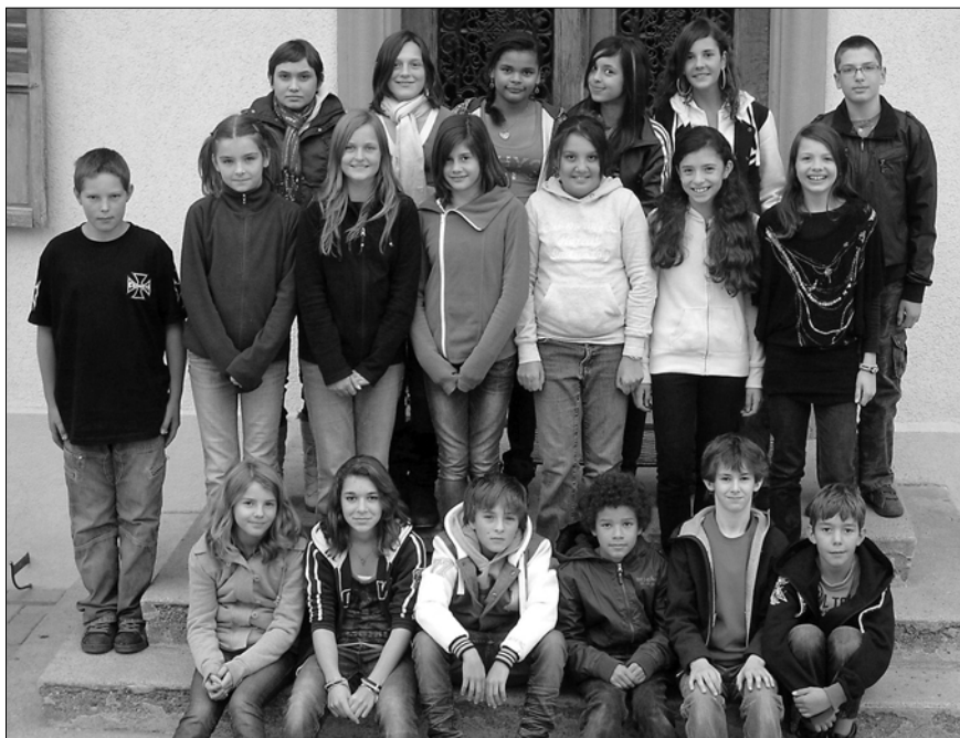
Photo des élèves de la classe 6P à Hauteville, prise le 11 novembre 2011. Pour des raisons de protection des données, les noms des élèves ne sont pas mentionnés.