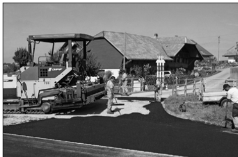
Le carrefour du pont près de la déchetterie