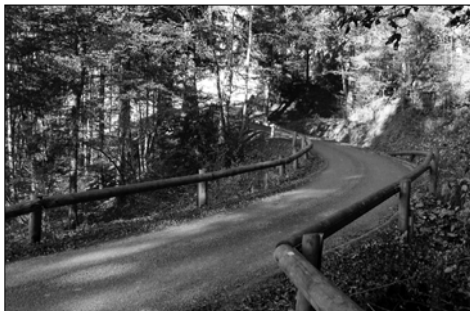
Le départ de la route du Mont