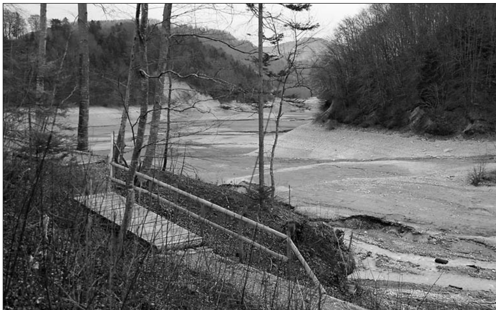
Vue depuis le sentier du lac à Cheseau Levrat : mais où est donc passé le lac ? (photo J.-M. Castella – 20 mars 2010)