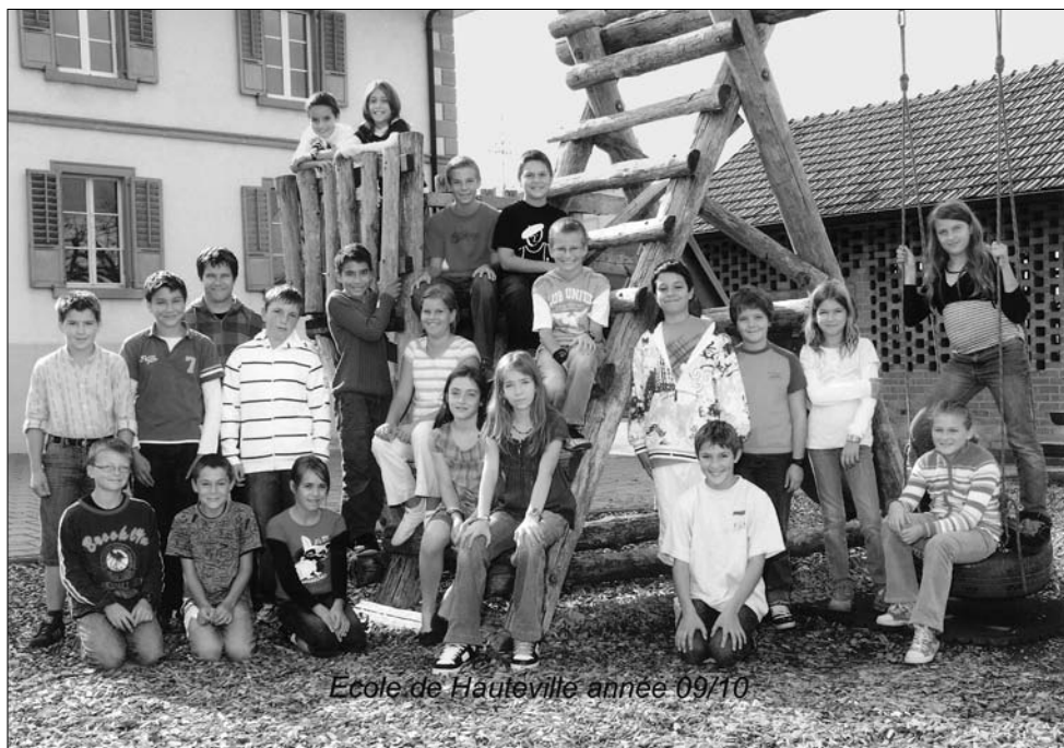
Ecole de Hauteville année 09/10

Photo des élèves de la classe 5-6P à Hauteville prise en automne 2009.