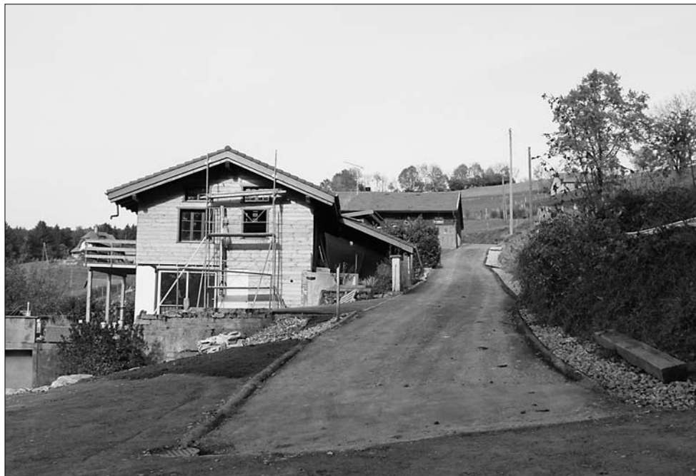
Chemin des Dailles

Après le chemin des Méley en 2008, il ne restait plus que quelques petits tronçons de chemins communaux à goudronner. C'est aujourd'hui chose faite, avec notamment le chemin des Dailles et le haut du chemin des Râpes, à l'embranchement avec la route du Manège. La commune en a profité pour effectuer encore quelques petites améliorations ou corrections çà et là. Coût total de l'opération : environ Fr. 40'000.-.