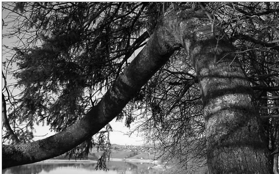
Arbre biscornu sur La Motta. On devine en arrière-plan le village de Pont-la-Ville.