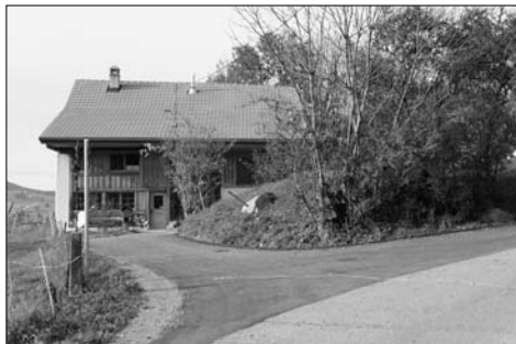
Haut du chemin des Râpes