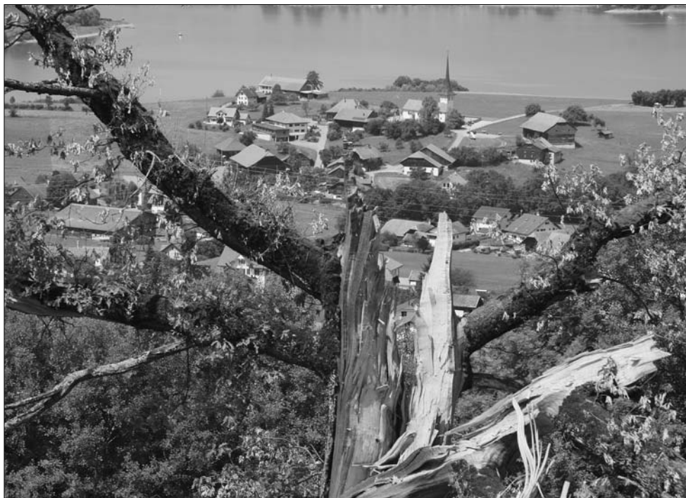
Chêne foudroyé au printemps 2007, près du Chalet des Communs d'Impart