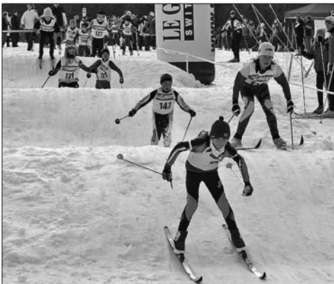
Le champ de bosses a été particulièrement apprécié des enfants.