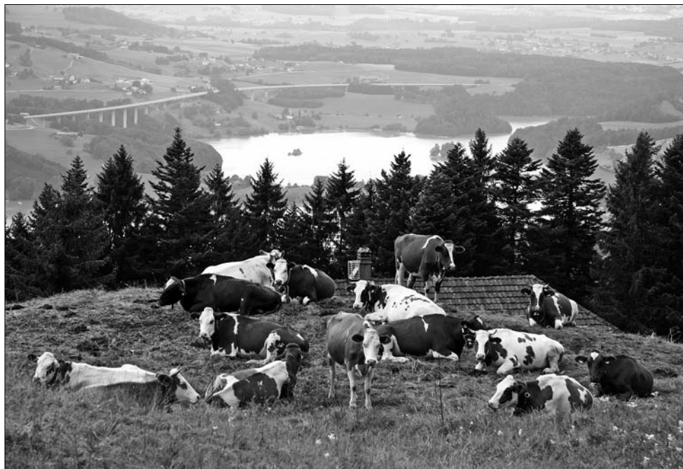
Les génisses aussi apprécient la vue!