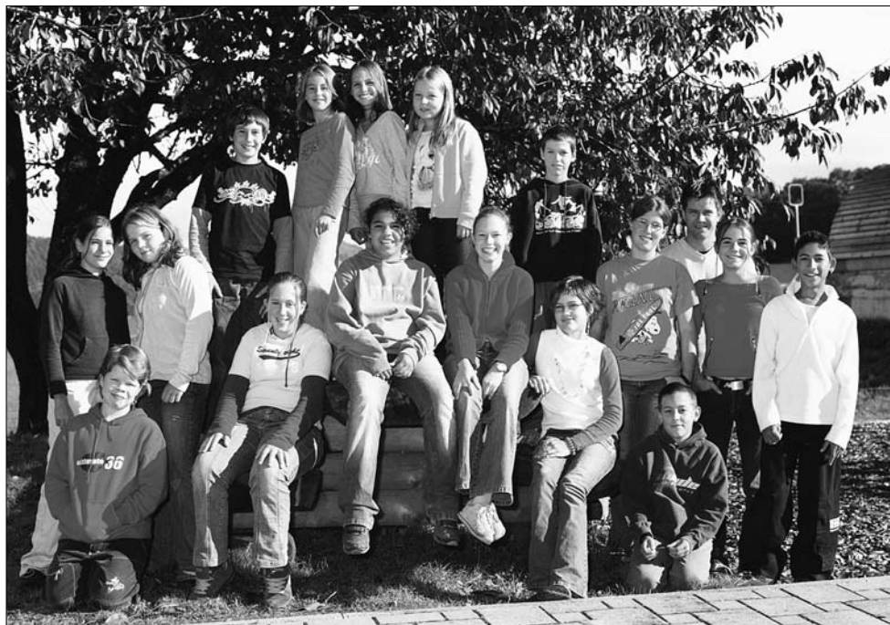
Photo des élèves de 6 ème primaire du cercle scolaire de Hauteville, Corbières et Villarvolard prise en octobre 2005 à Hauteville.

Au premier rang, assis ou accroupis, de gauche à droite: