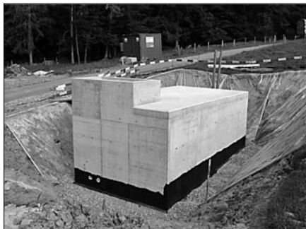
Réservoir «Bonne Fontaine» en cours de construction

Pour assurer l'alimentation en eau des divers secteurs mentionnés, un réservoir de 30 m 3 , équipé d'une installation de traitement UV, a été construit au lieu-dit «Bonne Fontaine» (1082 m). De là, un réseau d'environ 4 km de conduites a permis de raccorder une dizaine de propriétés, notamment les deux fermes communales du Mont Mafré et du Mont ainsi que les chalets d'alpages des Récards d'Avau et du Gros Lessert appartenant également à la commune. Profitant de ces travaux, les EEF ont aussi étendu et amélioré leur réseau électrique, offrant à l'ensemble des propriétaires non raccordés la possibilité de bénéficier d'une alimentation électrique.