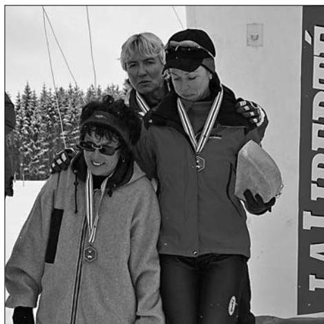
Nos trois «jeunes» médaillées posant pour la postérité.

Une première tout d'abord. Pour la première fois en effet, le Ski-Club Hauteville a aligné une équipe de relais féminine lors des championnats fribourgeois. Il ne reste qu'à souhaiter que les «jeunes» skieuses qui ont conquis une médaille de bronze ne s'arrêteront pas en si bon chemin.