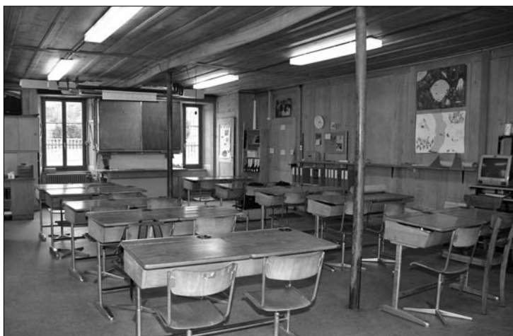
La salle de classe de 6P aujourd'hui avec ses parois et son plafond d'origine mais avec un équipement actualisé et bien sûr un chauffage central.

Les anciens pupitres d'une seule longueur allaient jusqu'à la paroi, une allée centrale permettait le passage. Plus de cent élèves, d'Hauteville uniquement, fréquentaient l'école certaines années d'avant 1950. Le pupitre du maître était surélevé, signe de l'autorité. Les tableaux non lignés, montés sur chevalets, pivotaient verticalement.