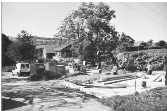
La déchetterie lors de son aménagement en été 2000

Afin d'éviter que des personnes non autorisées viennent déposer des déchets encombrants, lors du prochain ramassage, deux personnes se trouveront sur place, d'une part pour contrôler le genre d'objet encombrant et d'autre part pour contrôler si la personne présente est bien ressortissante de notre commune. Ce contrôle sera effectué dans l'intérêt de la commune et donc également du vôtre. Merci donc de faire preuve de compréhension.