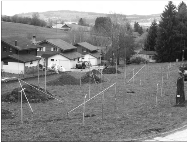
Les gabarits fleurissent depuis deux ou trois ans dans le quartier de Longemort

Un transcritteur de l'époque aurait-il dessiné approximativement le n, devenu r, d'où le nom actuel, Longemort? Dans la dénomination Longemont, on voit les mots «long» et «mont». La configuration du terrain, petites collines allongées alternant avec de modestes dépressions, pourrait donner du crédit à cette explication. Plus accrocheur l'éclairage donné au terme de Longemort par la légende de L'Ange mort, légende gruyérienne parue dans Le Vieux Chalet , supplément périodique du journal «Le Fribourgeois» aujourd'hui disparu. Mais c'est une autre histoire, pour plus tard, peut-être.