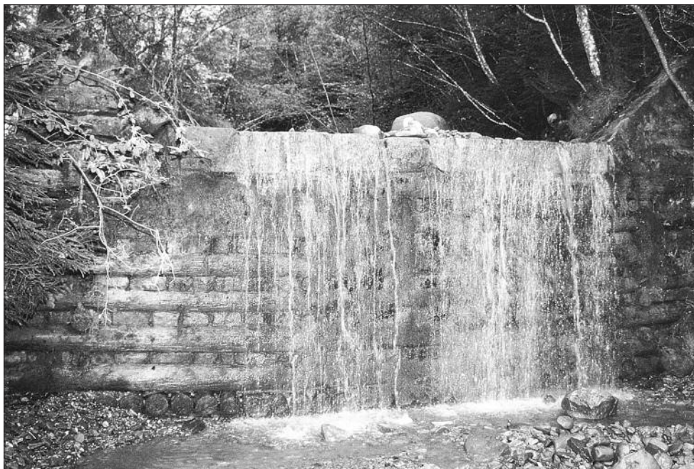
Cet ancien et magnifique barrage bois et pierres sur le ruisseau du Ruz a bien résisté aux crues extraordinaires des 9 et 10 juin 2000