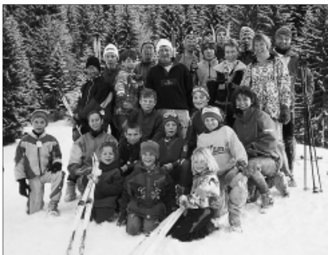
Un camp de ski pleinement réussi l'hiver dernier au Grand Bornand