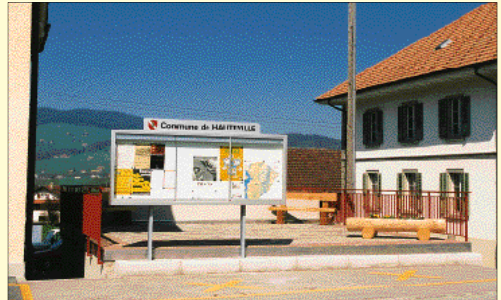
Un panneau d'affichage tout neuf et une place accueillante