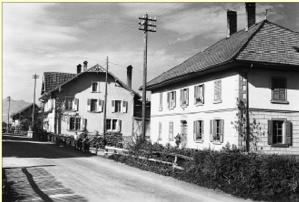
Vers les années 40 ...