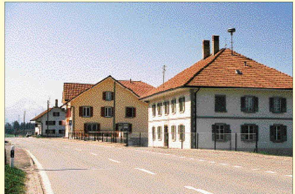
... et aujourd'hui